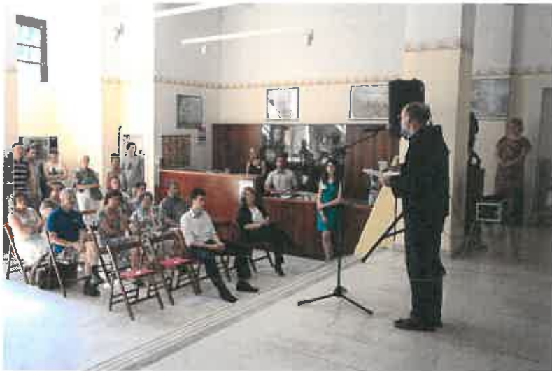
3. ábra: Kiállítás megnyitó