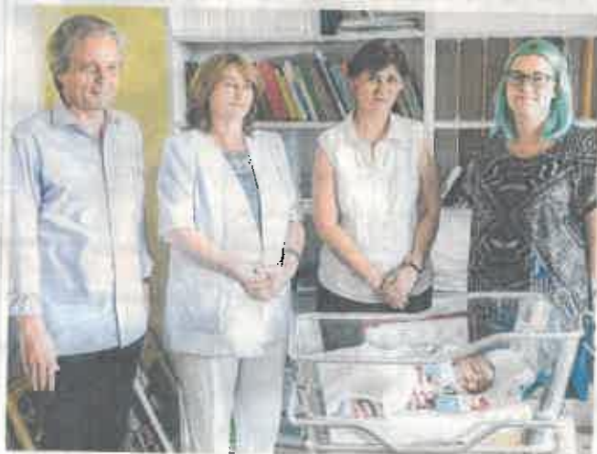
Az újszülöttek hasznos meglepetéseket kaptak

Ajándék a jövő múzeum-, galéria-, könyvtárlátogatóinak