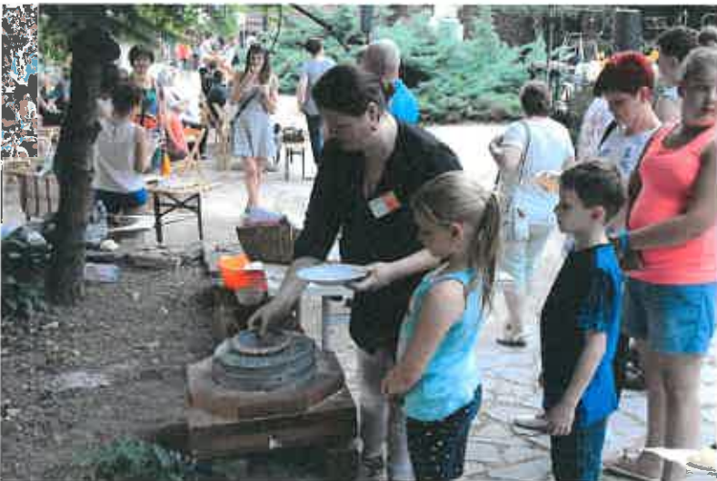
4. ábra: Élet a Bakonyi Ház játszótér