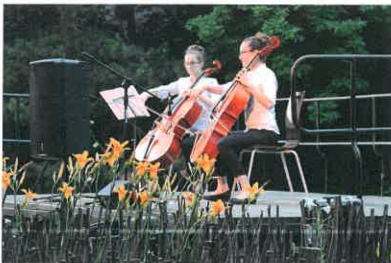
5. ábra: Fűke-tanítványok