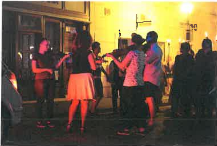
6. ábra: Fáklyás felvonulás