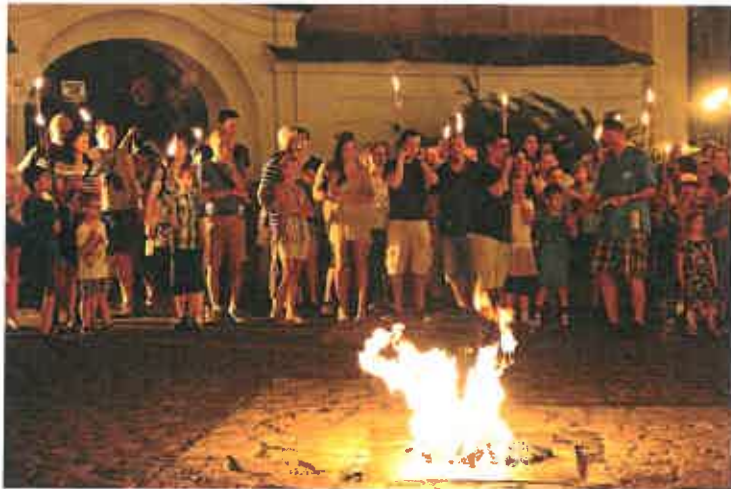
7. ábra: Tűzugrás