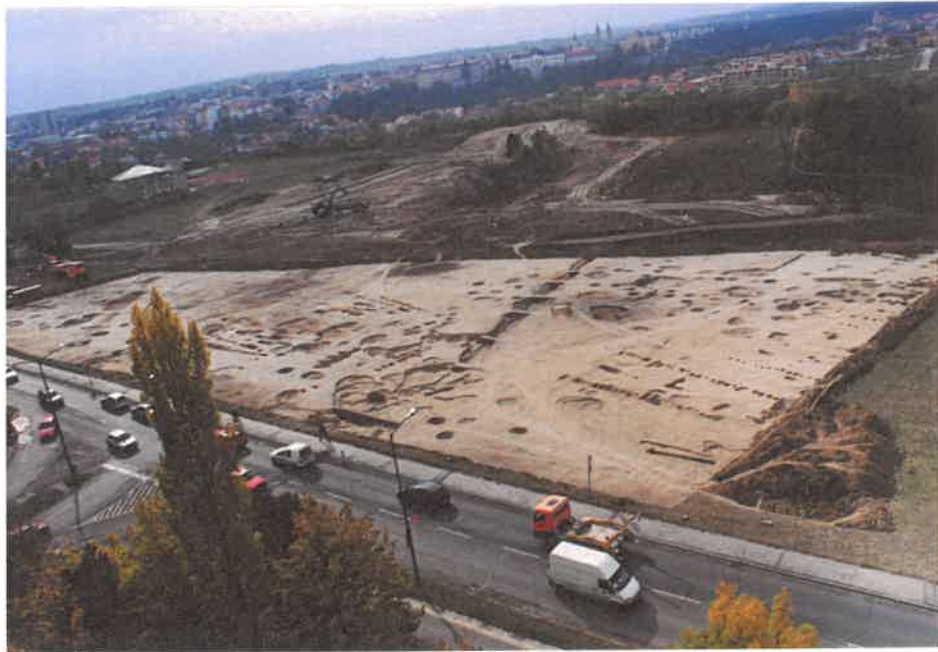
Neolitikus telep feltárása 2003-ban a Jutasi út mellett