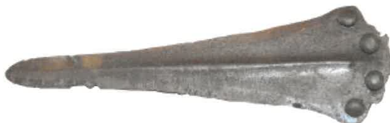
Bronzkori tőr a rendőrség környékéről

A Htv. 1. § (1) bekezdés m) pontjának való megfelelést valószínűsítő dokumentumok, támogató és ajánló levelek