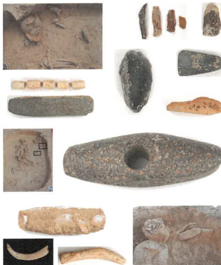
Az alapító sírja a Jutasi úti feltáráson