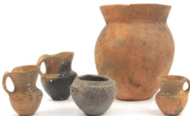
Bronzkori leletek a Thököly utcából