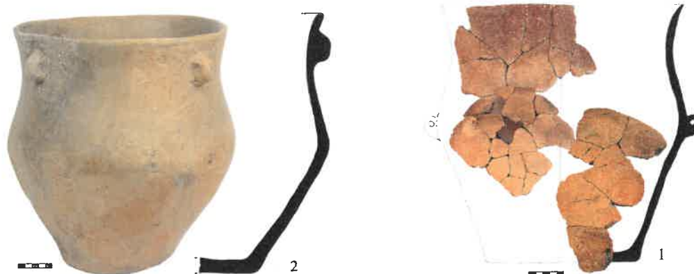
Leletek a feltárásból